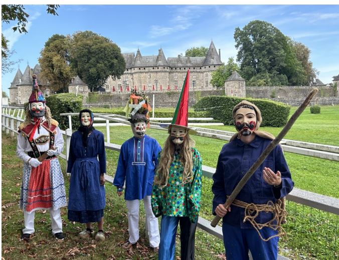
Masken in der Partnerstadt: An der Pferderennbahn mischten sich auch die Masken (Strohmänner, Fosenöchter, Jude, Hexen) aus allen Ortsteilen des Marktes Oberelsbach unter die Reise Teilnehmer. Für die Freunde aus Frankreich und Italien war das etwas ganz Besonderes. Im Hintergrund ist das Schloss von Arnac-Pompadour zu sehen.